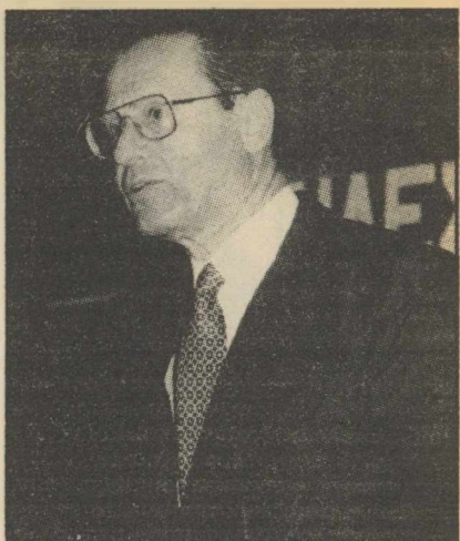
«Ανάγκη να επανέλθει η οικονομία στη μέγρι τώρα τροχιά της», τόνισε ο κ. Παπαλεξόπουλος στον κ. Ρουμελιώτη.