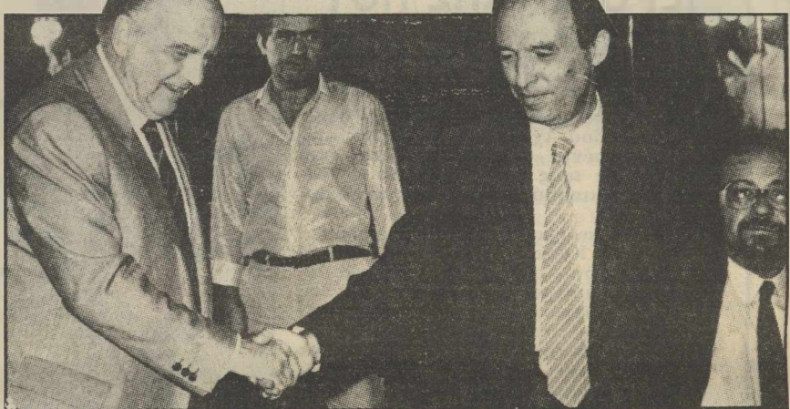
Παπανδρέου-Σημίτης όταν η φάρσα δεν είχε αρχίσει...

Μπαίνουν όμως στις τσέπες των υπολοίπων 25 δραχμές την ημέρα παραπάνω. Πώς βγαίνει αυτό το νούμερο; Να σας πούμε αμέσως. Τι έδινε ο Σημίτης; Διόρθωση μόνο για το πρώτο τετράμηνο την ΑΤΑ του πρώτου τετραμήνου δεν θα την έδινε από 1ης Ιανουαρίου αλλά από 1ης Μαΐου. Αν την υποθέσουμε αυτή την ΑΤΑ 4% (Σημ. τώρα με την παρέμβαση Παπανδρέου μπορεί να είναι και λιγότερο...), αυτό που θα έχαναν οι μισθωτοί είναι 4% επί 4,5 μήνες διά 14 μήνες για όλο το 1988 (14 μήνες είναι φυσικά οι 12 συν τα δύο και το επίδομα αδειας). Ο πολλαπλασιασμός αυτός και η διαίρεση σας δίνει ένα ποσοστό 1,285% που πολλαπλασιαζόμενο επί ένα μέσο μισθό 60.000 το μήνα σας δίνει ένα ποσό 7.710 δραχμών για όλο το 1988. Δηλαδή 25 - 26 δραχμές την ημέρα που γίνονται 13 δραχμές λιγότερο κι από την τιμή ενός κουλουριού - για τους χαμηλοσυνταξιούχους! Αυτό ήταν το δώρο του «φιλολαϊκού» πρωθυπουργού κι αυτό θα έχαναν αν εφαρμόζονταν η αρχική εξαγγελία περί ετεροχρονισμού της ΑΤΑ του πρώτου τετραμήνου που ανακοίνωσε ο κ. Σημίτης και ήταν