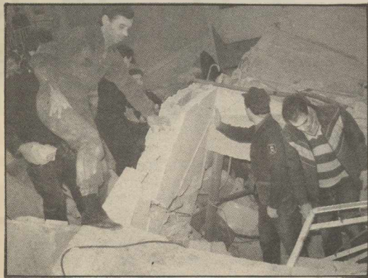
Ερείπια το τριώροφο στη Νίκαια.

Ειδικευμένος να κατασκευάζει υδροοράκτες και κανάλια ο κάστορας, διαλέγει το κατάλληλο μέρος που πρόκειται να