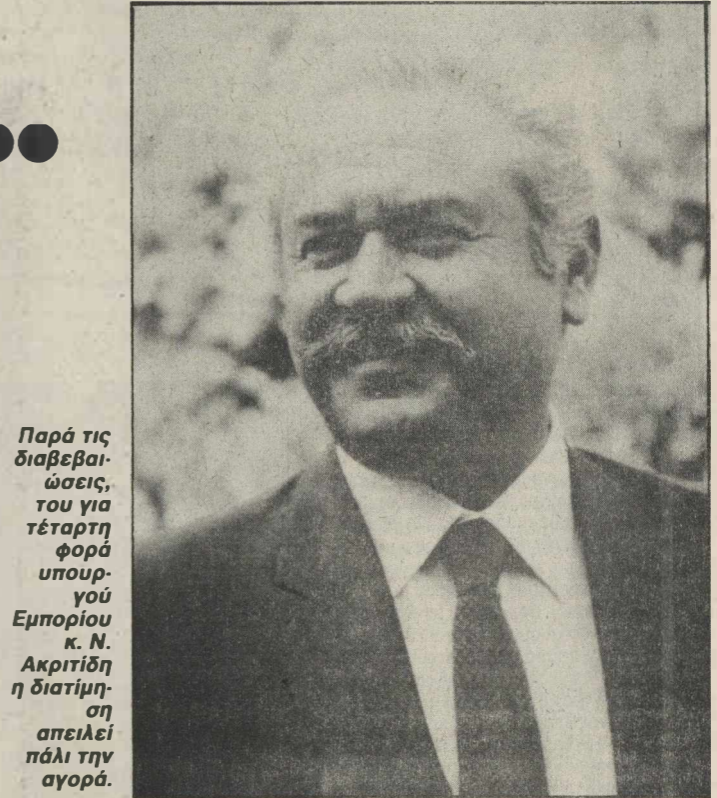
Παρά τις διαβεβαιώσεις, του για τέταρτη φορά υπουργού κ. Ν. Ακριτιδίδη η διατίμηση απειλεί πάλι την αγορά.

εφαρμόζει «σκιώθηκαν» οπωσδήποτε από την έμμση αλλά σαφέστατη προειδοποίηση ότι όλα αυτά ισχύουν υπό την προϋπόθεση ότι θα υπάρχει ομαλότητα στην αγορά. Αυτή η διευκρίνιση σημαίνει πρακτικά ότι όσες κατηγορίες προϊόντων «εφευδύνονται» από τις συμφωνίες, θα αντιμετωπίσουν τον κίνδυνο υπαγωγής στη διατίμηση. Πρόκειται οπωσδήποτε για μια απειλή, η οποία προκύπτει από την πρώτη στιγμή επιφυλάξεις, οι οποίες ενισχύονται και από το «παρελθόν» του κ. Ακριτιδίδη, που είναι γεμάτο συγκρούσεις και αντιθέσεις με τις παραγωγικές τάξεις. Τα ερωτήματα λοιπόν που δημιουργούνται και θέλουν απάντηση είναι: