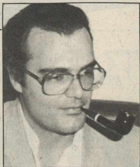
Γράφει ο ΑΛΕΞΑΝΔΡΟΣ ΒΕΛΙΟΣ