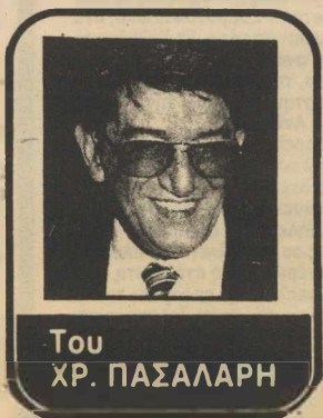
Του ΧΡ. ΠΑΣΑΛΑΡΗ

μένος με τις πορείες και τις απεργίες και ο άλλος μισός με τις εορτές και τις εξόδους, για να μετρήσουμε στο τέλος του έτους κάπου 50 εκατομμύρια χαμένες εργατοώρες που μαζί με άλλα 50 της διείσθησης της λιτότητας μας κάνουν εκατό, δηλαδή ένα παγκόσμιο ρεκόρ άξιο να μνημονευθεί σε μετάλλια και να καρφισωθεί αντί τριανταφύλλου στο πέτο του Έλληνας πρωθυπουργού, μαζί με το μετάλλιο των 20 δισεκατομμυρίων δολαρίων που χρω-