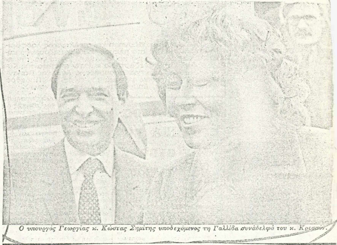
Ο υπουργός Γεωργίας κ. Κώστας Σημίτης υποδεχόμενος τη Γαλλίδα συνάδελφό του κ. Κοστανί.