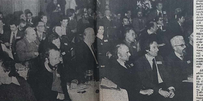
Μέλη της Κ.Ε. του ΠΑΣΟΚ κατά τη διάρκεια της 9ης συνόδου της

Ο νέος αυτός «θέζοντας» είναι μια σημαντική στιγμή στην ιστορία των σχέσεων μεταξύ των ΗΠΑ και της Σοβιετικής Ένωσης. Η επίσκεψη του Προέδρου Χάουαρντ Καν στην Ελλάδα και στην Κύπρο είναι μια σημαντική στιγμή στην ιστορία των σχέσεων μεταξύ των ΗΠΑ και της Σοβιετικής Ένωσης.