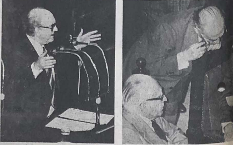
Ο Αρχηγός της αντιπολίτευσης Κωνσταντίνος Καραμανλής στην συνεδρίαση της Βουλής. Ο Καραμανλής συνοδεύεται από τον υφ. εξωτερικών Κωνσταντίνο Μανωλάκη, τον υφ. οικονομικών Γεώργιο Παπαδόπουλο, τον υφ. υγείας Κωνσταντίνο Καραμανλή και τον υφ. παιδείας Κωνσταντίνο Καραμανλή.

Μπορούσε να χαρακτηριστεί ποτέ οφθαλμική η μάχη που διεξάγεται στην Βουλή για την ανάληψη της εξουσίας από τον ΚΚΕ; Η απάντηση είναι ναι, γιατί η μάχη αυτή είναι η μάχη για την ανάληψη της εξουσίας από τον ΚΚΕ. Η μάχη αυτή είναι η μάχη για την ανάληψη της εξουσίας από τον ΚΚΕ. Η μάχη αυτή είναι η μάχη για την ανάληψη της εξουσίας από τον ΚΚΕ.