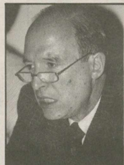
Αρθρο του ΚΩΣΤΑ ΣΗΜΙΤΗ και ομάδας συνεργατών του στο ΠΑΣΟΚ

Η προτεινόμενη εγκατάλειψη του στόχου ποσοτικής επέκτασης της γεωργικής παραγωγής στα πεδινά και η αναμενόμενη συρρίκνωση της γεωργικής απασχόλησης απαιτούν νέες θεσμικές παρεμβάσεις στον τομέα της αγροτικής πολιτικής. Ειδικότερα απαιτούν αναμόρφωση της συνεταιριστικής λειτουργίας, μείωση του κόστους της γεωργικής γης, προστατευόμενης την από την πίεση που ασκούν οικιστικές και τουριστικές χρήσεις, προσέλκυση νέων γεωργών με σύγχρονη επαγγελματική κατάρτιση και συνεχή παροχή τεχνικής υποστήριξης από αρμόδιους