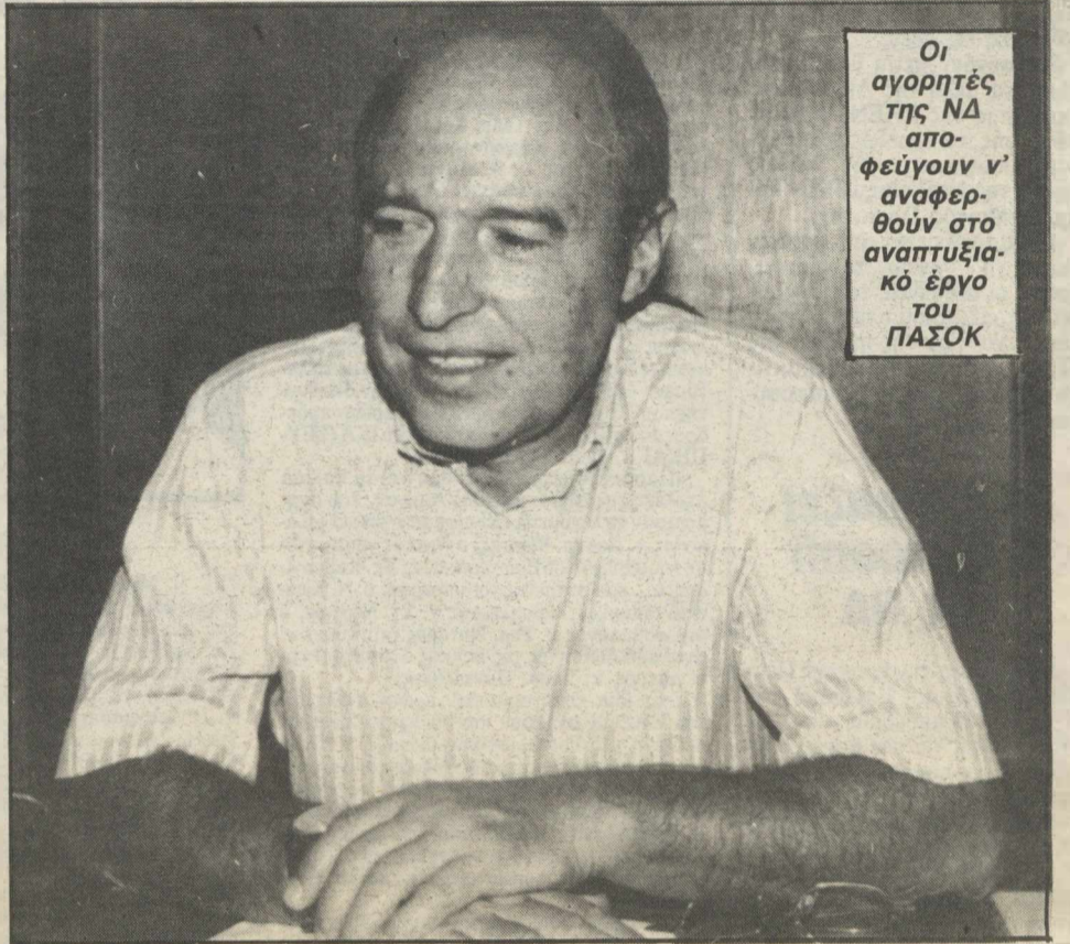
Οι αγορητές της ΝΔ αποφεύγουν ν' αναφερθούν στο αναπτυξιακό έργο του ΠΑΣΟΚ

● Θέλετε να πείτε ότι πέρα από τη στασιμότητα που παρουσιάζει η οικονομία με το πάγωμα των αποφάσεων από την παρούσα κυβέρνηση, η κατάσταση επιδεινώνεται και από το αρνητικό κλίμα εντυπώσεων, το οποίο απηχεί σε εσωτερικούς και