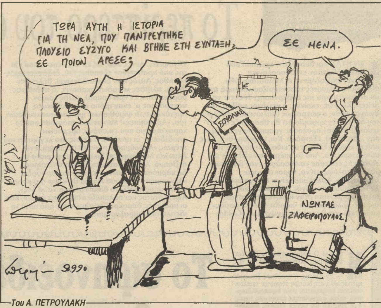
Του Α. ΠΕΤΡΟΥΛΑΚΗ