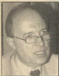
Του ΚΩΣΤΑ ΣΗΜΙΤΗ

Πρέπει να σημειωθεί, τέλος, ότι παραλλήλως με τις απόψεις του κ. Σημίτη διατύπωσαν στην ΚΟΕΣ η κ. Βάσω Παπανδρέου ο κ. Γ. Παπανδρέου και πολλοί άλλοι σύνεδροι, που θεωρείται ότι ανήκουν στην εκσυγχρονιστική πτέρυγα του ΠΑΣΟΚ.