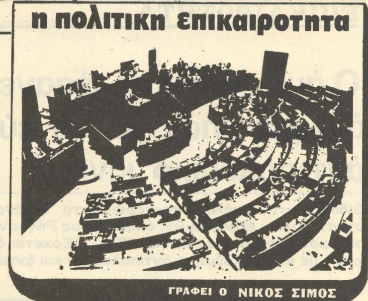
ΓΡΑΦΕΙ Ο ΝΙΚΟΣ ΣΙΜΟΣ

Δυσκολίες φαίνεται ότι πέρασε καί τό ΠΑΣΟΚ έσωκομματικά, μέ άμορφή τούς συνδυασμούς του καί ιδιαίτερα λόγω τής άποφάσεως νά μήν συμπεριληφθούν στά ψηφοδέλτια του Κινήματος τέσσερις γνωστοί βουλευτές, καθώς καί ή καθηγητής κ. Κ. Σπ-