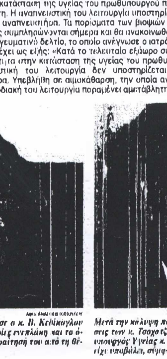
Αντιδρώντας στις κατηγορίες που διατύπωσε ο κ. Β. Κεδίκογλου της Βόρσης του υπουργού Υγείας και στις υποδείξεις επί πλάτη και το άνοιγμα του, ο Γρ. Σκαλκέας εξέβαλε την παραίτησή του... «Η καρδιακή του λειτουργία παραμένει αμεταβλήτη».

Σύμφωνα με το μεσημβρινό ιατρικό δελτίο, «κατά το τελευταίο 24ωρο η κατάσταση της υγείας του πρωθυπουργού παραμένει αμεταβλήτη... Το ιατρευτικό δελτίο, το οποίο ανέγνωσε ο ιατρός ο Άνδρας Λιβάνης έχει ως εξής: «Κατά το τελευταίο εβδόμη συνεχίζεται η επιθετικότητα στην κατάσταση της υγείας του πρωθυπουργού... Η καρδιακή του λειτουργία παραμένει αμεταβλήτη».