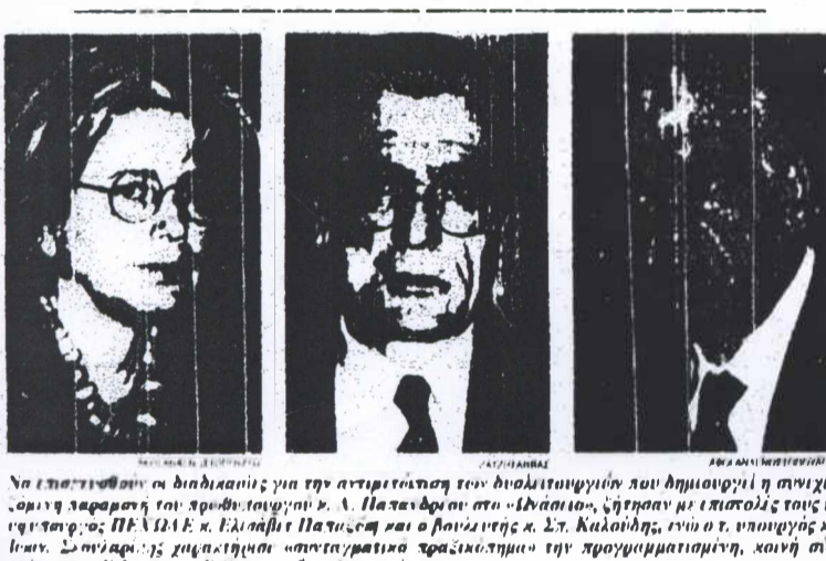
Να επισκευθούν οι διαδικασίες για την αντικατάσταση των πολιτικών που δημιουργεί η συνταγματική παραρτήση του πρωθυπουργού κ. Α. Παπανδρέου σε «δυσάρετα», ζήτησαν με επιστολές τους η Κ.Ο. ΠΑΣΟΚ κ. Ελεάνθη Παπαγιαννάκη και ο βοηθός της κ. Σπ. Καλλιόδη, ενώ ο υπουργός Επικρατείας κ. Α. Λιβάνης, και η Κ.Ο. του κυβερνώντος κόμματος.