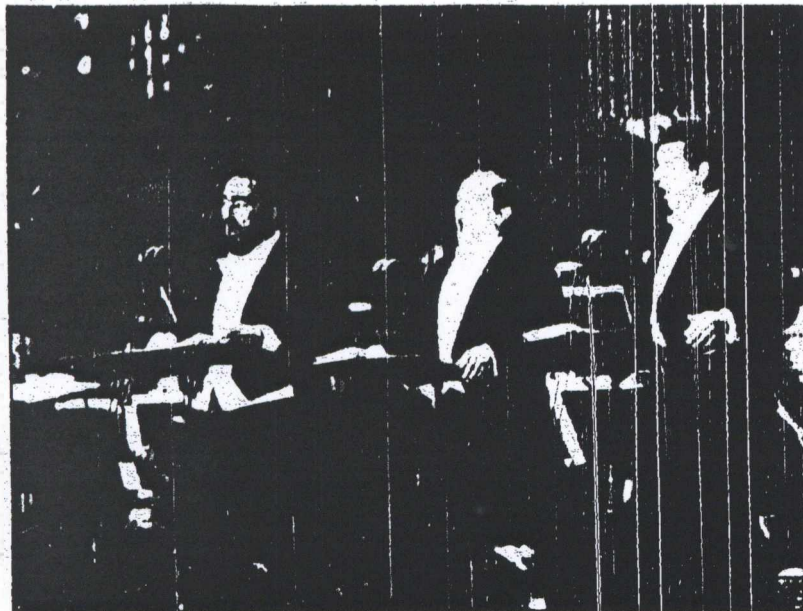
Ο πρώτος δίσκος τους ήταν υπέρμαχος - ο δεύτερος αποτυχημένος. Οι «τρεις τενόροι» Παβαρότι, Ντομίνγκο, Καρέρας - δεν κατάφεραν να επαναλάβουν στη σιναί την επιτυχία της σιναίλιας τους στη Ρώμη το '90.

1 Οι τρεις τενόροι, II. Ο δίσκος επιβεβαιώνει το αξίωμα του Μαρέ ότι η ιστορία επαναλαμβάνεται - τη δεύτερη φορά ως κωμωδία. Οι τρεις υπήρξαν υπέροχοι στη Ρώμη το 1990, ήταν γελοίοι στο Λος Άντζελες, στους Ολυμπιακούς του '94, όπου ο Λουτσιάνο Παβαρότι, ο Πλάσιντο Ντομίνγκο και ο Χοσέ Καρέρας «πιπαγάλισαν» τις άριές τους με φόντο έναν τεχνητό καταρράκτη.