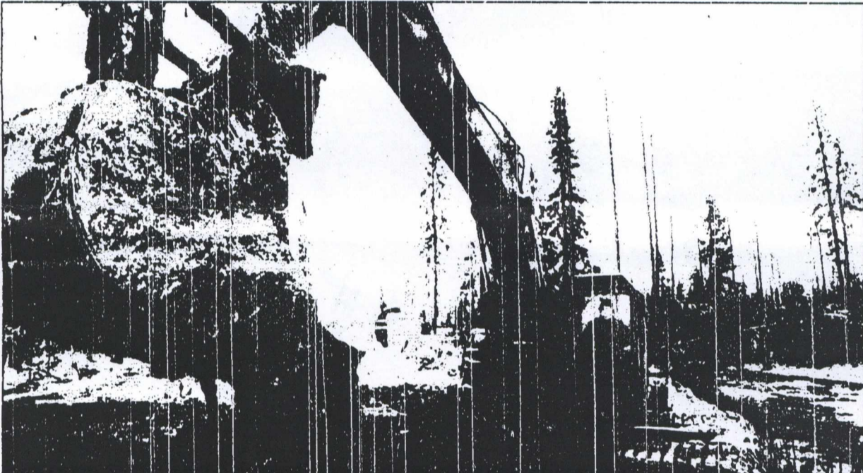
Μια από τις μεγαλύτερες οικολογικές καταστροφές στον πλανήτη τα τελευταία χρόνια συνέβη στη ρωσική Αρκτική, όταν πάνω από 200.000 τόννοι πετρελίου διάφρασαν από ανεπαρκώς ασφαλισμένο πλοίο τον Ωκεφόρο τον '94.

2 Πληθυσμός. Η διάσπαση του ΟΗΕ για τον πληθυσμό ήταν αρκετά επηρεαστική και φιλοξένησε αντιμαχόμενες απόψεις, αλλά κατέληξε σε απρόσμενη αρμονία. Οι 180 χώρες που πήραν μέρος συμφώνησαν σε ένα σχέδιο που κλείει τις κυβερνήσεις να δαπανούν ετησίως γύρω στα 17 δισεκατομμύρια δολάρια έως το 2000 για να υποστηρίξουν τον οικονομικό προγραμματισμό, την πρωτοβάθμια περίθαλψη και τα προγράμματα που ενισχύουν τις γυναίκες, με βάση την τεκμηριωμένη θέση ότι οι γυναίκες που ελέγχουν τη ζωή τους τείνουν να αποκτήνουν λιγότερα παιδιά. Άρα, κι αν οι αποφάσεις του Καίρου δεν τηρηθούν περισσότερο από αυτές της διάσκεψης του Ρίο για τη Γη, δεν πρέπει να φοβόμαστε πληθυσμιακή έκρηξη στο άμεσο προσεχές μέλλον.