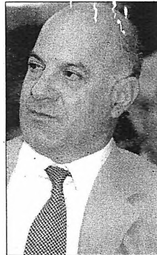
Αναδράσεις από Βενιζέλο και Λοβέρδο-όχι από Σημίτη μέσω Κοσμίδη...