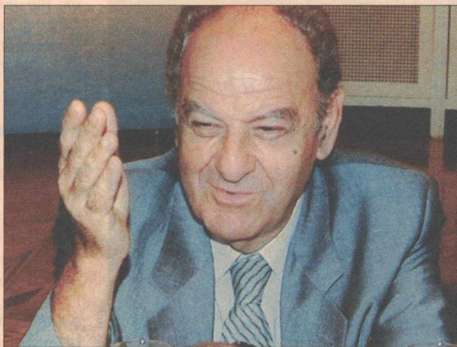
➤➤ Είναι ολίγον κωμική η διαβάθμιση της εντιμότητας στη ζωή.