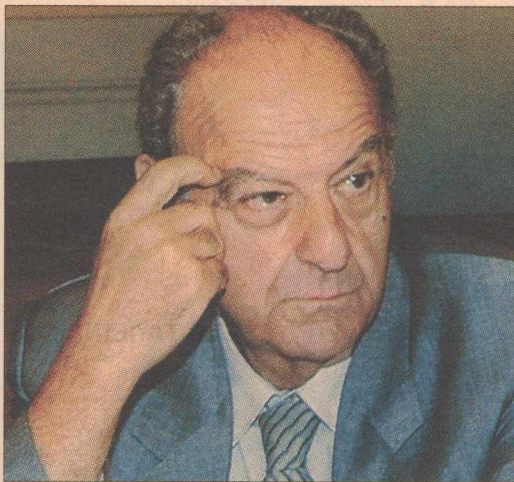
► Πέτρος Πετρόπουλος, οδός Αγίου Πέτρου στην Πετρούπολη; Που να ξέρω ότι είναι ψευδώνυμο;

Ευ. Βενιζέλος: Τι σας είπε, λοιπόν, όταν επικοινωνήσατε μαζί σας μετά την εκλογική του νίκη; Τι σας πρότεινε