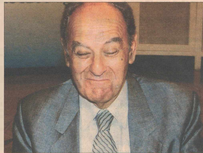
➤➤ Η ταπεινότης μου δεν γνωρίζει κύριε καθηγητά...

γού να βεβαιώσει από του βήματος της Βουλής ότι η προβλεπόμενη εγγύηση είναι εταιρική. Κάντε εσείς τον χαρακτηρισμό μόνος σας.