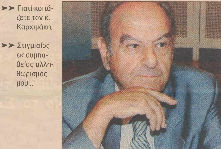
►► Γιατί κοιτάζετε τον κ. Καρχιμάκη;