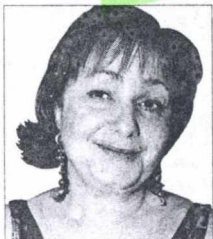
Επίκαιρο το ερώτημα «ποιοι κυβερνούν αυτό τον τόπο», λέει για τα διαπλεκόμενα η Μ. Φραγκιαδάκη.