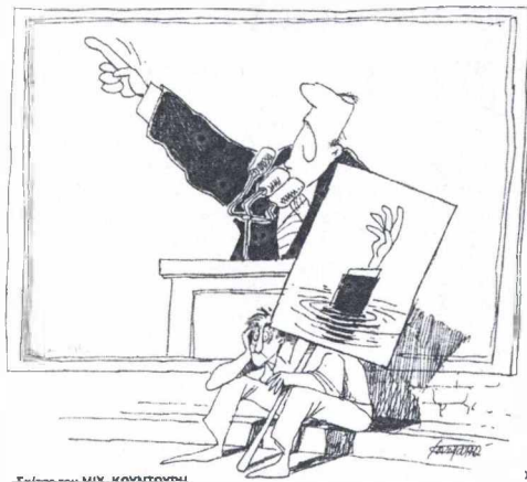
Σκίτσο του ΜΙΚ ΚΟΤΤΑΚΗΣ

Σε κάτι που σίγουρα δεν θα προσέθει δυναμική στην εικόνα του Σημίτη. Θα πείσει, αντίθετα, την κοινή γνώμη πως η κυβέρνηση αντί να ασχολείται με τα κοιά της προβλήματος, προσπαθεί απλά να την εντυπωσιάσει με εκείνα που ελάχιστο την αφορούν.