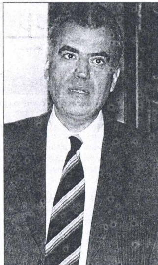
Ο Δημήτρης Ρέππας μίλησε για νέα αρχή και ταμές αφήνοντας ανοικτό το ενδεχόμενο για ένα συνέδριο ανασύνθεσης του ΠΑΣΟΚ.

αλλαγές στον εκλογικό νόμο και τη συζήτηση για εκουγχρονισμό των θεσμών».