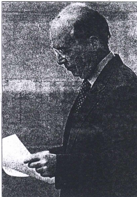
Ο κ. Σημίτης δεν μπορεί να προσβλέπει στην πλήρη στήριξη, στην παρούσα εξαιρετικά δυσμενή για τον ίδιο συγκυρία, των κορυφαίων στελεχών.