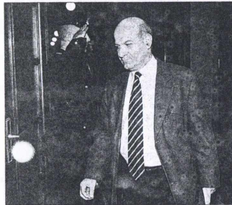
Αυτοπρά προσωπικές χαρακτήρισε τις απόψεις που εξέφρασε ο κ. Κοσμίδη, χωρίς, όπως είπε, να αποτυπώνουν τις προθέσεις του πρωθυπουργού.

«Ποιος άδειασε ποιον στη συγκεκριμένη περίπτωση;», αναρωτήθηκαν οι βουλευτές και τα στελέχη του ΠΑΣΟΚ, που έσπευσαν να χαρακτηρίσουν «μικρόνου» τον κ. Κοσμίδη, αφού κατάφερε με μια κίνηση να εκθέσει και τον πρωθυπουργό και τον