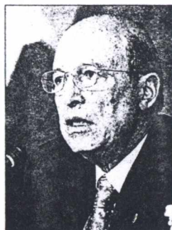
Ο κ. Σημίτης είχε ενημερωθεί για τις δηλώσεις Κοσμίδη από τον ίδιο το σύμβούλό του.

Το σύνολο του κόμματος από τη μια πλευρά και οι συνεργάτες του πρωθυπουργού από την άλλη επιδόθηκαν σε έναν σκληρό πόλεμο τηλεφωνημάτων και επιχειρημάτων και αλληλοκατηγορίας. Οι μεν υποστήριξαν ότι δεν υπάρχει πρόβλημα με τις προτάσεις Κοσμίδη και οι δε ότι υπάρχει σοβαρό πρόβλημα που αδυνατούν να κατανοήσουν