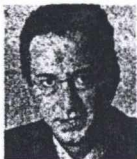
Του ΜΠΑΜΠΗ ΠΑΠΑΠΑΝΑΓΙΩΤΟΥ

Ε ΙΝΑΙ ο άνθρωπος που για λίγες ώρες έβαλε «φωτιά» στα πορτοκαλί τηλέφωνα των ανησυχούντων υπουργών και υφυπουργών, αλλά και στα όνειρα των υπουργισίμων και υφυπουργισίμων βουλευτών. Απ' όλες τις ενδιαφέρουσες και αξιοπρόσεκτες προτάσεις του, μία ήταν εκείνη που προκάλεσε την πρωτοφανή ενδοκυβερνητική και εσωκομματική αναστάτωση: Ο περιορισμός των υπουργείων σε 12-14 και η ταπθήτηση μόνο ενός υφυπουργού σε κάθε υπουργείο. Με λίγα λόγια, εν μια νυκτί περιόρισε σχεδόν κατά το ήμισυ τον αριθμό των μελών του υπουργικού συμβουλίου. Από 49 που είναι σήμερα πρότεινε να περιοριστούν σε 24-28. Κάτι που δεν ανεχόταν ο... τράχηλος ούτε των υπουργών που κινδύνευαν να μείνουν χωρίς υπουργείο ούτε των «υπουργών εν αναμονή» που θα έμεναν με τα φρεσκοραμμένα καστούμια τους στην ντουλάπα. Από εκεί και πέρα η συνέχεια είναι γνωστή: Κύμα συνταξιωμένων διαφεύσεων απ' όλα τα επικαιρονομαστικά κέντρα κυβέρνησης και κόμματος, καθώς ο Κ. Σημίτης αντελήφθη ότι μόλις ένα χρόνο πριν από τις εκλογές δεν μπορούσε να πορευτεί με τον «ακρατό» του δυσχερυσμένο και απογοητευμένο.