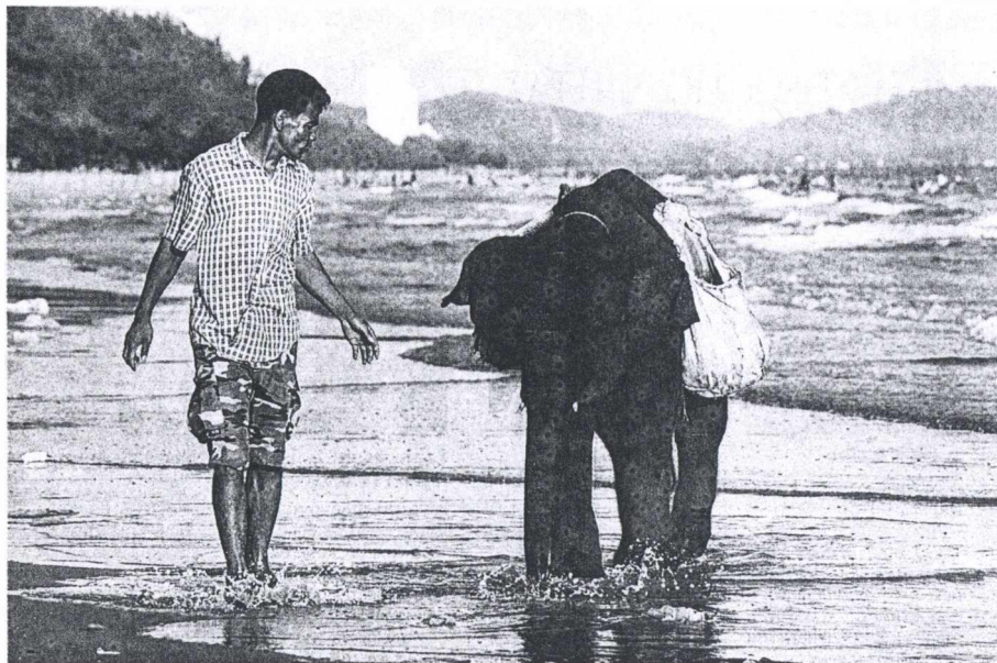
Προσέξτε τη φωτογραφία και βάλτε τη φαντασία σας να εργασθεί. Το εν λόγω ζώον είναι εκπαιδευμένος ελέφας που – όπως γίνεται με τους εκπαιδευμένους σκύλους – ψάχνει για χαμένες θέσεις εργασίας; Οχι. Είναι μήπως μεταφορικός ελέφας που φέρνει τις αλλαγές στο πολιτικό σύστημα που θα εισηγηθεί ο Πρωθυπουργός και ο κύ-

Τί άλλο; Α, ό,τι γνωρίζετε περι χωματερές δεν είναι τίποτε μπροστά σ' αυτά που έχουμε σήμερα επί του θέματος. Ολόκληρος φακέλος, σαν αυτούς που είχε παλιότερα η Ασφάλεια για τους αριστερούς. Έχουμε, λέει, χίλιες τόσες χωματερές ανά την επικράτεια, κανέναν άλλος δεν μας παραβγαίνει. Χωματερές ελεύθερες – άραγε υπάρχουν και πανηρέμενες; – που τους μπαίνουν στο μάτι των Ευρωπαίων και θέλουν να μας τις κλείσουν. Αμ, δε. Σ' αυτή τη χώρα δύο πράγματα δεν θα κλείσουν ποτέ: οι χωματερές και η τηλεόραση – φιλοξενούν ακριβώς το ίδιο πράγμα.