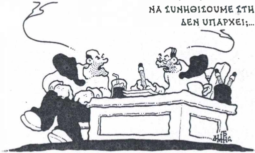
ΤΟΥ ΔΗΜΗΤΡΗ ΧΑΝΤΖΟΠΟΥΛΟΥ