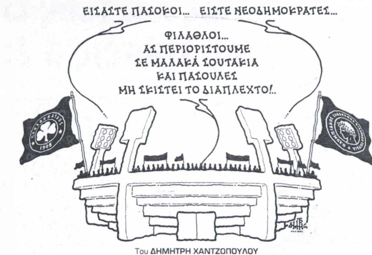
Του ΔΗΜΗΤΡΗ ΧΑΝΤΖΟΠΟΥΛΟΥ

φού ο Λυκουρέζος είναι τύπος που δικηγόρει «περ λ' αμόρε ντελ άρτε», όπως λένε οι ρομαντικοί Ιταλοί. Αλλά, βέβαια, με τη δικη της 17N τελειωμένη και τη Ν.Δ. να σφραγίζεται κυβέρνηση όπως ο καρχαρίας το αίμα, ο Αλέξανδρος ίσως καταφέρει να απεξαρτηθεί από τα δικόγραφα με την ελπίδα της κυβερνητικής καρέκλας.