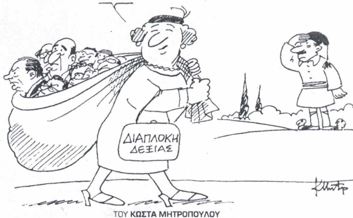
ΤΟΥ ΚΩΣΤΑ ΜΗΤΡΟΠΟΥΛΟΥ

Οι μεγάλες αλλαγές, πρέπει να γίνουν ή στην αρχή της κυβερνητικής πλειοψηφίας ή αργότερα με μια ευρύτερη πολιτική συναίνεση