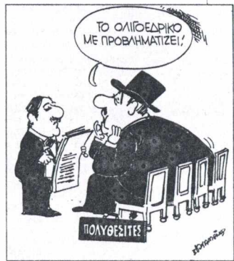
ΤΟΥ ΔΙΟΤΕΗ ΚΑΜΕΝΟΥ

«Δεν αναφέρονται στον παρόντα χρόνο» οι προτάσεις του Σ. Κοσμίδη, διαμήνυσε ο Κ. Σημίτης, μέσω Τ. Κυτήρη, από τη Βαρσοβία. Το... νέο «Σύμφωνο της Βαρσοβίας». Ν.Ρ.