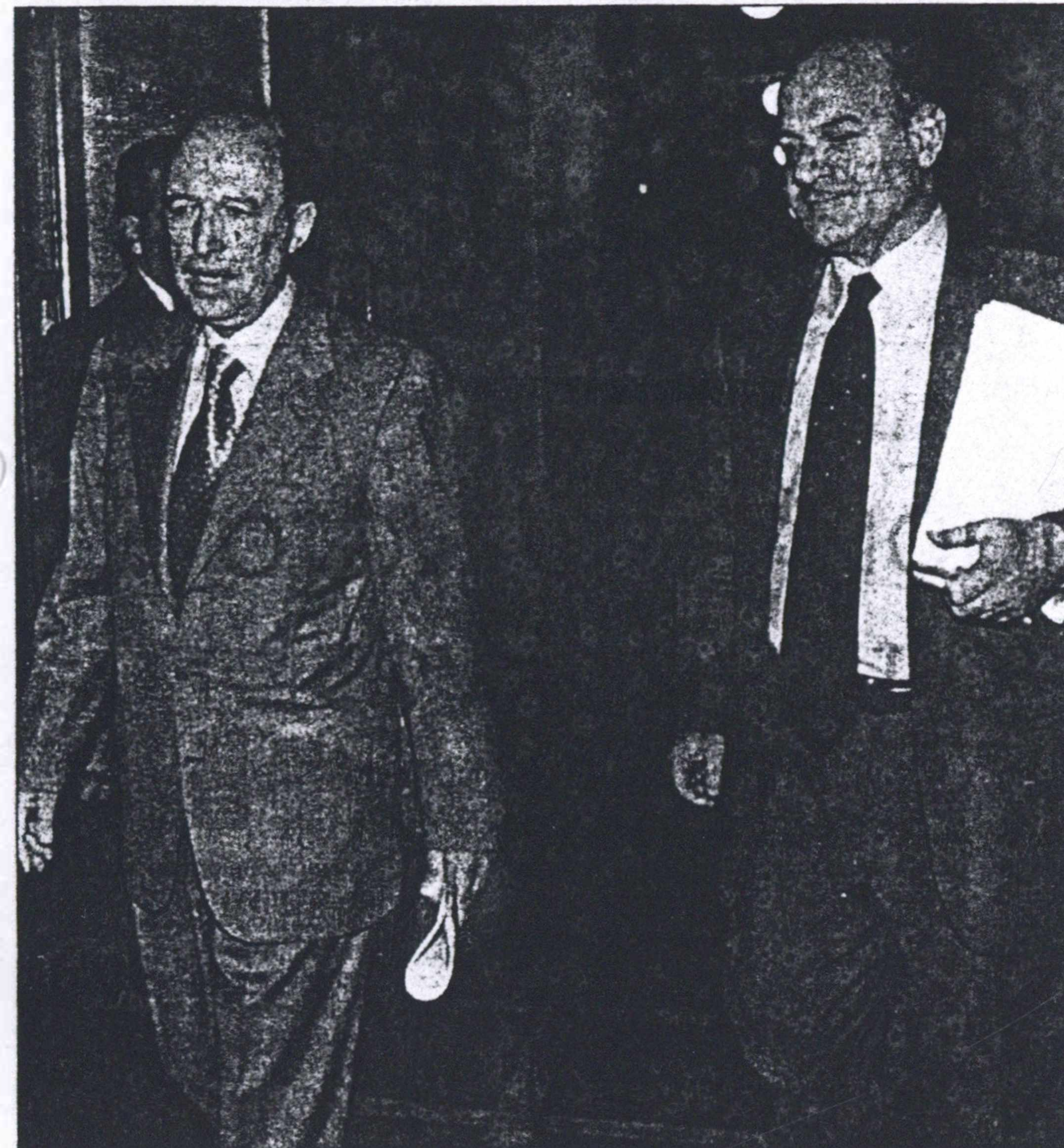
Εκτός από την τηλεφωνική συνομιλία του με τον Σ. Κοσμίδη (στη φωτογραφία με τον Κ. Σημίτη) χθες από τη Βαρσοβία, ο πρωθυπουργός συζήτησε και με στενούς του συνεργάτες.

Η άποψη αυτών των στελεχών συμπιέζει με την εκτίμηση ότι η ομάδα του σκληρού πυρήνα του κ. Σημίτη το τελευταίο διάστημα, μετά την κόντρα με τον κ. Κουρή, έχει αποδεκατιστεί και κάποιοι προσπαθούν να ανασυνταχθούν μέσω προτάσεων δημιουργώντας «ομάδες στήριξης» μέσα σε κόμμα και κυβέρνηση.