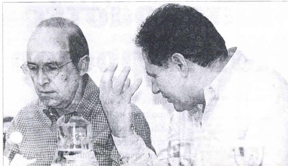
Ο γραμματέας της Κεντρικής Επιτροπής Κώστας Λαλιώτης ζήτησε την αποδοκιμασία του γραμματέα του Υπουργικού Συμβουλίου, Σωκράτη Κοσμίδη.

Δεύτερον, διότι τώρα θυμήθηκαν οι οπαδοί του κ. Σημίτη τον εκουχρονισμό, δηλαδή οκτώ ολόκληρα χρόνια από τότε που κυβερνούν τον τόπο.