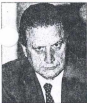
Ο βουλευτής της Ν.Δ. κ. Βύρων Πολύδωρας.

Απαράδεκτες χαρακτήρισε τις δηλώσεις του Γενικού Γραμματέα του υπουργικού Συμβουλίου κ. Κοσμίδη ο βουλευτής της Ν.Δ. κ. Β. Πολύδωρας.