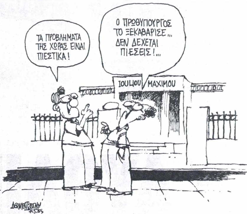
ΤΟΥ ΓΙΑΝΝΗ ΔΕΡΜΕΝΤΖΟΓΛΟΥ