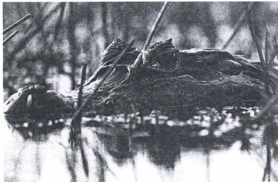
Το εικονιζόμενο αν δεν είναι το πολιτικό σύστημα που ακούει τον γραμματέα του Υπουργικού Συμβουλίου να αναγγέλλει τον αφανισμό του. Ένας απλός αλιγότερος είναι - προς Θεού, όχι συμβολισμός με ημετέρους οικονομικούς παράγοντες και πολιτικούς - από τη Βραζιλία - σαν τον Τσιοβάνι - και έχει τους λόγους του που τον βλέπετε σκεπτικό. Τα μέρη του είναι ιδανικά για οικοτουρισμό αλλά επειδή και οι Βραζιλιάνοι σαν εμάς είναι, τα πήρε και τα σήκωσε με τη βιομηχανική ανάπτυξη και τώρα το ατυχές θηρίον απαρεί: δεν θα ήταν καλύτερα να έμπαίνα κι εγώ στη Σοφοκλέους;

Εν συνεχεία ο Πρωθυπουργός είπε με νόημα στον συνεργάτη του: «Σωκράτη, έχε τον νου σου, θα λείψω πέντε-έξι μέρες». «Για πού με το καλό;». «Να, για Βαλτική λέω». «Μακριά είναι - δεν το αφήνεις;». «Δεν γίνεται, πρέπει να δω τι γίνεται με τους καινούργιους που βάλανε στην Ευρώπη». «Με τους παλιούς που βάλανε στη Σοφοκλέους είναι το θέμα». «Αυτούς τους αφήνω επάνω σου». «Καλό ταξίδι τότε και μη σε νοιάζει, άμα πέσουμε θα σε ειδοποιήσω». «Καλή αντάμωση στον Σκορδά τα καταλύματα» (σ.σ.: σημαντική παραφθορά της έκφρασης «στον Σκορδά το Χάνι») κι όπως είπαμε. Τι είχαν πει;