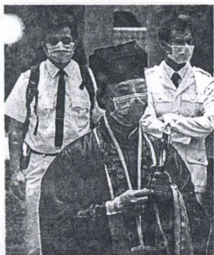
Τεοσίτης ιερέας, φορώντας μάσκα, ευλογεί τους παρισταμένους σε κηδεία νοσούκμας του Χονγκ Κονγκ η οποία πέθονε από SARS