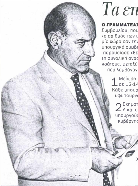
Σωκράτης Κοσμίδη. Χρόνια τώρα υποστηρίζει ότι «ο αριθμός των υπουργείων είναι μεγάλος για μια χώρα σαν την Ελλάδα»

Οτιδήποτε δεν είναι καθόλου σύγγραφο ότι την ίδια αντίληψη έχει και ο Πρωθυπουργός Κώστας Σημίτης, ο οποίος αντιμετώπιζοντας τη χειρότερη κρίση των τελευταίων