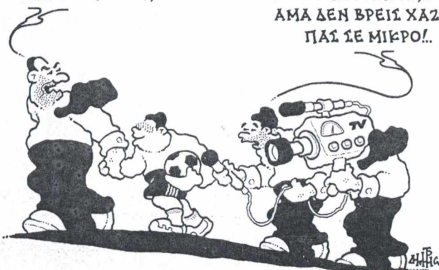
Του Δημήτρη Χαντζόπουλου