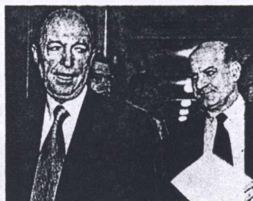
Ο Πρωθυπουργός Κ. Σημίτης και ο Σ. Κοσμίδης

Σαρωτικές αλλαγές σε εκλογικό νόμο και περιφέρειες