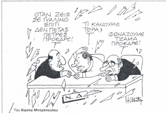
Του Κώστα Μιτράκουλου

ΠΑΡΑΓΩΓΗ & ΗΛΕΚΤΡΟΝΙΚΗ ΥΠΟΣΤΗΡΙΞΗ: MULTIMEDIA A.E.