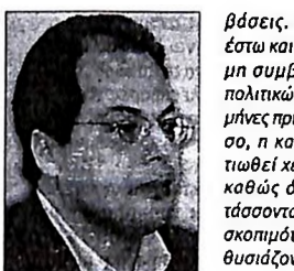
Ο βουλευτής της Ν.Δ. Π. Καμμένος.

Σταδιακά όμως άρχισα να αμφιβάλω, διότι δεν σας έβλεπα πρόθυμο να αποδοκιμάσετε εμπρακτα τις παρεκτροπές των συνεργατών σας. Τον Οκτώβριο, δε, με αφορμή την ερώτηση ενός ακροδεξιού βουλευτή -η οποία είναι, βέβαια, τίτλος τιμής για μένα...- βεβαιώθηκα, πλέον, ότι όλα ήταν εν γνώσει σας και έτσι σας υπέβαλα, απηυδαρισμένος, την παραίτησή μου. Με παρακάλεσα τότε να μείνω, με την υπόσχεση ότι όλα θα διορθωθούν και ότι η συνεργασία μας στο εξής θα κινήσει στις αρχικές