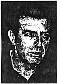
Ετον Μ. Χρυσόχοιδη χρεώνεται η αποτυχία του Εθνικού Συμβουλίου.

Αργά το βράδυ ο υπουργός Τύπου Χρ. Πρωτόπαπας, που βρισκόταν στην Κύπρο, χαρακτήρισε ως «γελοιοδότες» τα σενάρια περί διαδοχής του πρωθυπουργού πριν από τις εκλογές, διέψευσε φημολογία περί αναστασιασμού και πρόσθεσε ότι δεν τίθεται θέμα «επανεξέτασης της υποψηφιότητας των εν ενεργεία βουλευτών».