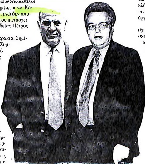
Σε Χρυσοδουλάκη, Χρυσοχοϊδη, Κορμιδη και Θεμέλη θα απολογούνται οι υπουργοί

Το σενάριο των πρόωρων εκλογών τον Νοέμβριο ενισχύεται και από τις πληροφορίες που φτάνουν από το Μέγαρο Μαξίμου, οι οποίες επισημαίνουν πως αν τον Σεπτέμβριο οι δημοσκοπήσεις φέρουν το ΠΑΣΟΚ να εκτοπίσει τα