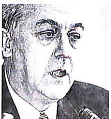
Οι κκ. Θ. Πάγκαλος (επάνω) και Α. Παπαδόπουλος ακούγονται ως υποψήφιοι για το Εκτελεστικό Γραφείο