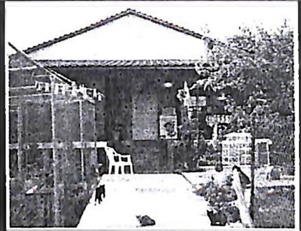
ΤΟ ΣΠΙΤΙ όπου βρέθηκε ο 83χρονος.

Σε κολαστήριο για τον 83χρονο πατέρα τους μετέβησαν μια απόφαση μονοκατοικία οι δύο άσημοι κόρες του. Για 16 μήνες κρατούσαν φυλακισμένοι τον ανήμπορο υπηρέτη σε ένα δωμάτιο σωστό κλουβί. Σε συνθήκες απόλυτης εξαθλίωσης. Ο άτυχος γέροντας ήταν υποχρεωμένος να ζει με τις ακαθαρσίες του, περιτριμμένος σε ένα χώρο 5 τετραγωνικών μέτρων. Το Κωσταλέι αναβίωσε, αυτήν τη φορά στο Αγγελοχώρι Θεσσαλονίκης.