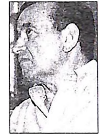
Με νέο κύμα καταγγελιών υπουργών και στελεχών του κόμματος απειλεί ο Γιώργος Κουρέας.

Επίθεση στον υπουργό Τύπου Χρήστο Πρωτόπαπα από την «Αυριανή» - Κατηγορείται ότι χρηματοδοτήθηκε με 200 εκατ. από τον Αθανασούλη για το εκλογικό του κέντρο - «Δεν πήρα δραχμή» απαντά ο εκπρόσωπος