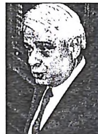
Με πρωτοβουλία του κ. Κακλαμάνη διεξήχθη η ψηφοφορία, με την οποία καταψηφίστηκε το νομοσχέδιο. Καθοριστική η αρνητική ψήφος του κ. Γιαννόπουλου και το «παριών» του κ. Παπαθεμελί. Κατήφης αποχώρησε ο κ. Σκανδαλίδης, ενώ απθέτως ικανοποιημένος ο κ. Παυλιόπουλος.

τέλος των ομιλιών των βουλευτών, όμως η συντομότερη ομιλία του επιβεβαίωσε ότι απλώς αποσκοπούσε, με τη δήλωσή ότι «είμαι ανοιχτός σε προτάσεις», απλώς στο να κερδίσει πολιτικό χρόνο και να μην υποστεί η κυβέρνηση την ήτα της καταψηφίσεως στην επιτροπή. Ο κ. Σκανδαλίδης κάλεσε τους βουλευτές να αναμείνουν την Ολομέλεια και κυρίως την έκθεση του Επιστημονικού Συμβουλίου.