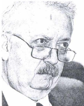
Από αριστερά: Αποχωρεί ύστερα από έξι χρόνια στην προεδρία του Αρείου Πάγου ο κ. Στ. Ματθίας. Ο υπουργός Δικαιοσύνης κ. Φ. Πετσάλνικος έχει ήδη ολοκληρώσει τη μελέτη όλων των υπηρεσιακών φακέλων των ανώτατων δικαστικών λειτουργιών, ενώ ο γενικός γραμματέας του Υπουργικού Συμβουλίου κ. Σ. Κοσμίδης συζητάει με στελέχη της Νέας Δημοκρατίας τις προτάσεις του κόμματός τους

Η αναστάση στελεχών της με τον υπουργό Δικαιοσύνης αλλά και με τον γενικό γραμματέα του Υπουργικού Συμβουλίου κ. Σωκράτη Κοσμίδη είχαν ακριβώς αυτό τον στόχο. Να δηλώσει εκ των προτέρων το κόμμα της αξιωματικής αντιπολίτευσης τις θέσεις του και τις απόψεις του επί του θέματος.