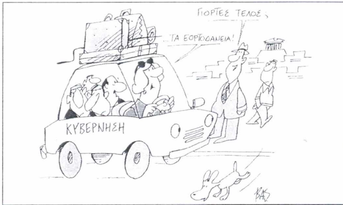
Του ΒΑΣ. ΜΗΤΡΟΠΟΥΛΟΥ

Αντίρριου!.. Όλους τους παραπάνω χαρακτηρισμούς έδωσε ο "Αδέσμευτος" στην Ελλάδα του Σημίτη. Και, δυστυχώς, σε όλους επιβεβαιωθήκαμε... ☹