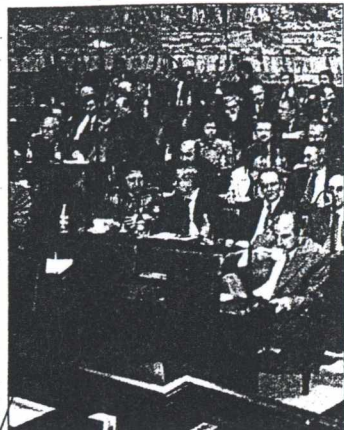
«Δεν είμαστε πρόβατα» λένε οι βουλευτές του ΠΑΣΟΚ με αφορμή την αντιμετώπιση που έχουν από τους υπουργούς.