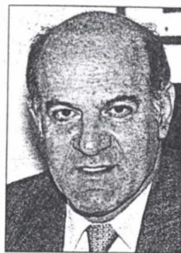
Ο γενικός γραμματέας του Υπουργικού Συμβουλίου Σωκράτης Κοσμίδης

Στην... αντεπίθεση περνά η κυβέρνηση, όσον αφορά την ψήφιση των εκτελεστικών νόμων για την εφαρμογή του νέου Συντάγματος, καθώς το πρώτο δίμηνο του 2002 κατατίθενται στη Βουλή όλοι νόμοι -λόγω ανασχηματισμού- δεν κατατέθηκαν το τελευταίο δίμηνο του περασμένου έτους, όπως προβλέπονταν από τον αρχικό, σφικτό προγραμματισμό.