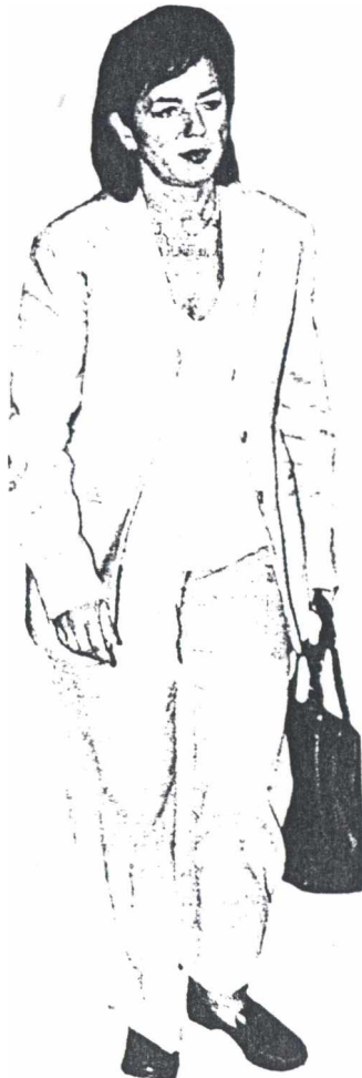
Η κ. Βάσω Παπανδρέου.

Το ΥΠΕΧΩΔΕ συνεχίζει τη θεσμοθέτηση ειδικών χωροταξικών μελετών στα νησιά και τις παράκτιες περιοχές. Ήδη προωθήθηκαν ρυθμίσεις για την Πάτμο και την Τζια. Χιλιάδες ιδιοκτησίες ακρηστεύονται. Η αρτιότητα των εκτός σχεδίου οικοπέδων από 4 αυξάνεται σε 8 έως 10 στρέμματα, ενώ ισχύουν απαγορεύσεις όσον αφορά τις αποστάσεις από την παραλία, το ανάγλυφο του εδάφους κ.ά. Ο χωροταξικός σχεδιασμός έχει προχωρήσει ικανοποιητικά για 5 περιφέρειες και ιδιαίτερα στην Κρήτη και τη Θεσσαλία.