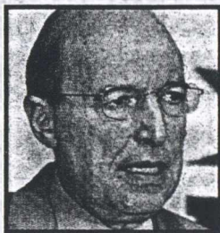
Με τον νέο γραμματέα της Κεντρικής Επιτροπής του ΠΑΣΟΚ κ. Κ. Λαλιώτη (δεξιά) θα συναντηθεί αυτή την εβδομάδα ο πρωθυπουργός κ. Κ. Σημίτης

Το αυστηρό «μάντζιμεντ» δεν συνδέεται με συγκεκριμένα υπουργεία ή υπουργούς αλλά αφορά το σύνολο της κυβέρνησης που χρήζουν ειδικής προσοχής αλλά αυτό δεν σημαίνει ότι θα υπάρξει «ειδική μεταχείριση» υπουργών. Αντιθέτως, η γραμμή του καθημερινού ελέγχου αγγίζει τους πά-