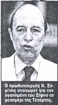
Ο πρωθυπουργός Κ. Σημίτης αναχωρεί για την αγαπημένη του Σίφνο το μεσημέρι της Τετάρτης.

Ο γραμματέας του ΠΙΑΣΟΚ Κ. Σκανδαλίδης θα είναι στη Λήμνο ως τις 5 Αυγούστου, 5-7 στην Αθήνα θα πνίγεται στα χαρτιά για τις θέσεις και το καταστατικό, ενώ τις υπόλοιπες διακοπές του θα τις περάσει στην Κω.