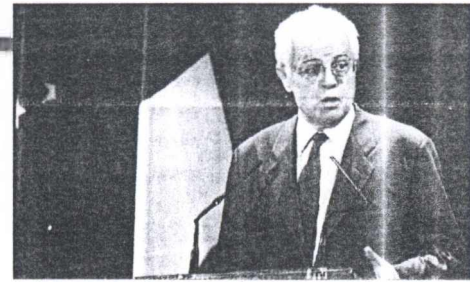
Στις 10 Σεπτεμβρίου του 2001 ο πρωθυπουργός θα δεχθεί στην Αθήνη τον Γάλλο πρωθυπουργό Λιονέλ Ζοσπέν.

Στις 12 Νοεμβρίου θα επισκεφθεί τη Σλοβακία, ενώ στα τέλη Οκτωβρίου και μέσα Δεκεμβρίου θα λάβει μέρος στις δύο Συνόδους Κορυφής της Ευρωπαϊκής Ένωσης στις Βρυξέλλες και το Λέκκεν του Βελγίου.