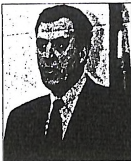
Ο πρωθυπουργός Κ. Σημίτης απορρίπτει την επαναφορά της διαρχίας, όπως προκύπτει από δηλώσεις του υπουργού Τύπου, Δημ. Ρέππα.