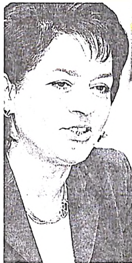
Ενταση στις σχέσεις Βάσως Παπανδρέου και Σωκράτη Κοσμίδη

Προς τι όμως αυτή η κινητικότητα μεσοτόνος του θέρους; Η κυρία Παπανδρέου μοιάζει σήμερα να μην μπορεί να απαλλαγεί από τα «φαντάσματα» τα οποία έχει η ίδια επικαλεστεί. Τα «φαντάσματα» αυτά δεν είναι τίποτε άλλο από τις δεσμεύσεις που έχει αναλάβει με την εκπόνηση του προγράμματος «Πολιτεία», η υλοποίηση του οποίου προϋποθέτει ριζικές με κατεστημένα συμφέροντα, συντησιακές νοστροπίες και πολιτικές σκοπιμότητες. Στόχος της, ως εκ τούτου, δεν μπορεί παρά να είναι να αποσπάσει με την έγκριση του Υπουργικού Συμβουλίου ώστε να χειριστεί εν δυνάμει τη μεταρρύθμιση του δημοσίου τομέα, η οποία αντικειμενικά θα προκαλέσει ποικίλες αντιδράσεις ακόμη και στο εσωτερικό της κυβέρνησης.