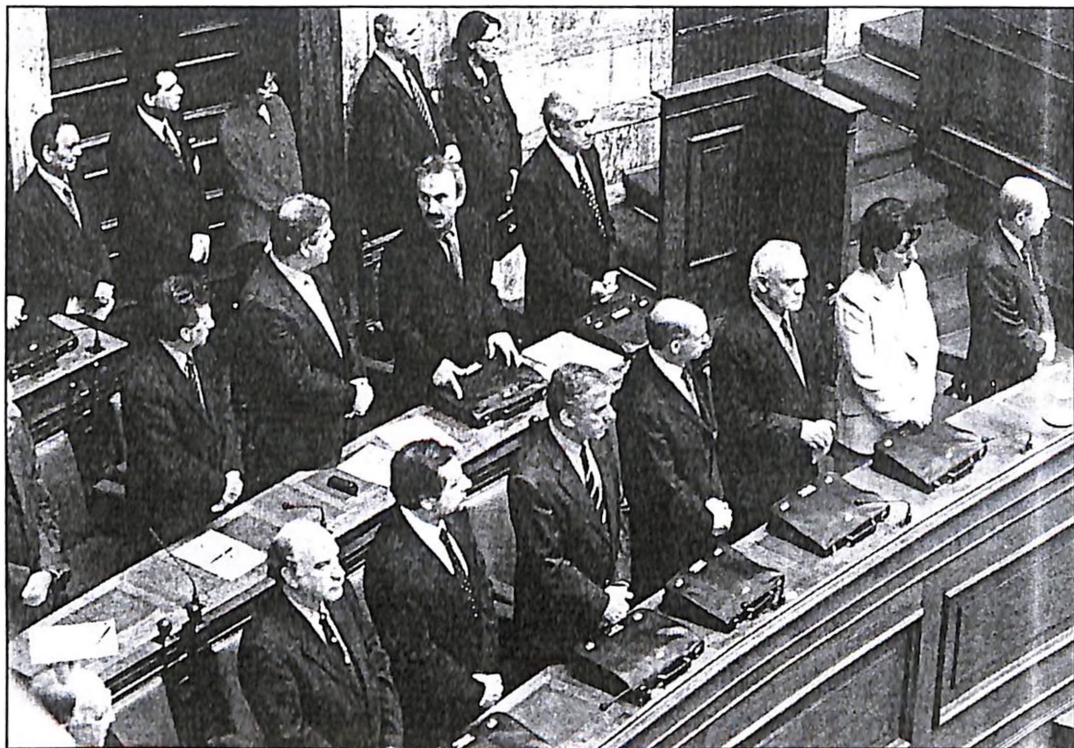
Του ΤΑΣΟΥ ΠΑΠΑ

2 Επί «μηδενικής βάσης» ξεκινούν όλα στο υπουργείο Εθνικής Άμυνας: Συνεργάτες του Α. Τσοχατζόπουλου κάνουν λόγο για «αρωματικές αλλαγές» - ακόμη και στο προσωπικό επιπέδου του. • Στη μίση από τις τρεις γενικές διευθύνσεις του υπουργείου, η μία θέση έχει «αδειάσει» μετά την εκλογή