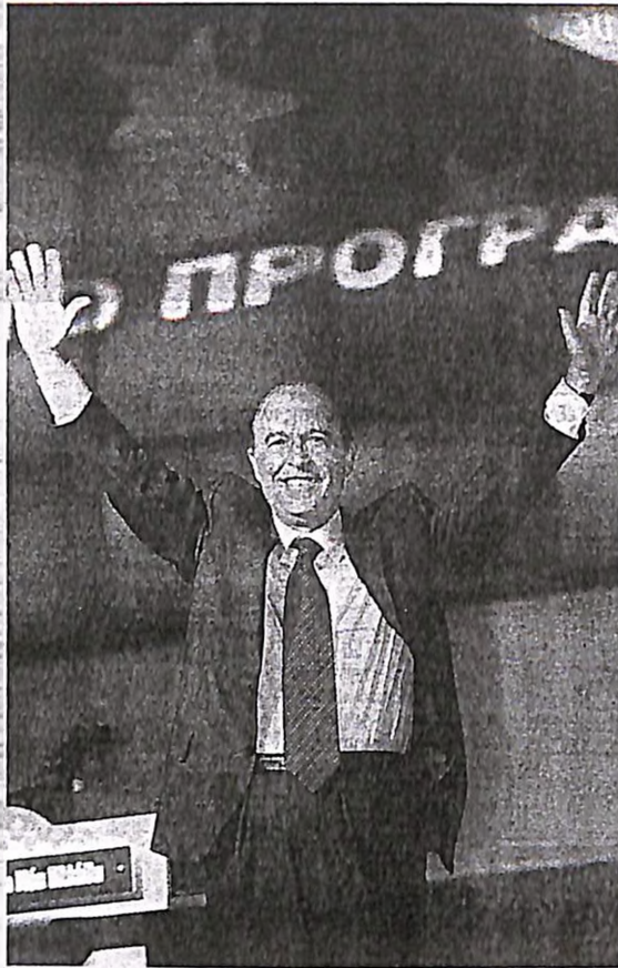
Ο πρωθυπουργός κ. Κ. Σημίτης ανακοίνωσε ήδη στους ενδιαφερομένους τα πόστα που θα αναλάβουν στην προεκλογική μάχη

Αυτή τη στιγμή, όμως, ο κ. Λούλης είναι περίπου ανεπιθύμητος στη