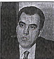
Ενώ ο κ. Ρέππας δηλώνει ότι την κυβέρνηση δεν την απασχολούν οι εκλογές και ο κ. Αρσένης ότι δεν συμμετέχει στον τζόγο που αφορά τις κάλπες στη Χ. Τρικούπη, στο Μαξίμου και στη Βουλή κορυφαία κυβερνητικά στελέχη, ενίοτε και με την προεδρία του πρωθυπουργού, συνεδριάζουν με θέμα τις εκλογές

«Είναι προφανές ότι το πλέγμα αυτό των δηλώσεων του πρωθυπουργού επισημάνει αντιφάσεις και μικροκομματικές σκοπιμότητες, αποκαλύπτει σύγχυση και αβεβαιότητα στον ίδιο. Η υπεύθυνη θέση του πρωθυπουργού απαιτεί υπεύθυνη τοποθέτηση. Υποχρεούται, λοιπόν, να ξεκαθαρίσει πια από όλα αυτά ποστέι. Να τοποθετηθεί ξεκάθαρα».