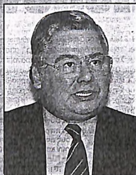
«Είναι ανάγκη ο πρωθυπουργός να ξεκαθαρίσει άμεσα το τοπίο και να διευκρινίσει πότε θα διεξαχθούν οι εκλογές», τόνισε μεταξύ άλλων ο πρώην πρόεδρος της Ν.Δ. κ. Μ. Εβερτ

Δριμύτητα επίθεση εναντίον της κυβέρνησης για την καλλιέργεια κλίματος εκλογολογίας εξαπέλυσε χθες η Νέα Δημοκρατία. Μιλώντας για τις συνέπειες που έχει η κυβερνητική αυτή τακτική, ο πρώην πρόεδρος της Νέας Δημοκρατίας κ. Μ. Εβερτ σημείωσε: «Η πρόκληση εκλογολογία που έχει καλλιεργηθεί με την ανοχή της κυβέρνησης βλάπτει την οικονομία, εντείνει τις πληθωριστικές πιέσεις, δημιουργεί ύφεση στην αγορά και επηρεάζει αρνητικά το χρηματιστήριο.