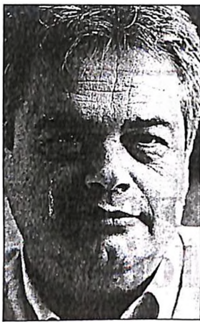
Ο λόγος του Ν. Θέμελη, ως παλαιότερου συνεργάτη του Πρωθυπουργού, μετράει στις αποφάσεις όταν πρόκειται να γίνουν αλλαγές στην κυβέρνηση

Ο ίδιος ο Κ. Σημίτης θορυβήθηκε όταν πληροφορήθηκε