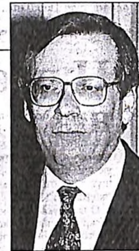
Στέφανος Μάνος. Ο πρόεδρος των Φιλελευθέρων πήρε θέση υπέρ Στεφανόπουλου