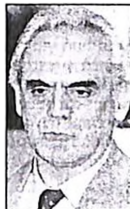
Ο υπουργός Αμύνης κ. Α. Τσοχατζόπουλος εμφανίστηκε για άλλη μια φορά ενθουσιώδης

« Ο λοι είμαστε στην ίδια βάρκα. Και πρέπει όλοι να προσέξουμε την πορεία της βάρκας, γιατί έτσι και ανατραπεί, τότε όλοι βουλιάζουμε» είπε ο υπουργός Εθνικής Αμύνης κ. Α. Τσοχατζόπουλος στα κομματικά στελέχη του ΠαΣοΚ στη Χίο, όταν προχθές αυτά επέτθηκαν με δεξιά χαρακτηρισμούς εναντίον μελών της κυβέρνησης, που «με την ανυπαίχτη πολιτική τους διώνουν τους παραδοσιακούς ψηφοφόρους του ΠαΣοΚ μακριά». Ο υπουργός εμφανίστηκε ενθουσιώδης, αλλά δεν παρέληψε να σημειώσει ότι χρειάζεται αλλαγή στην πολιτική της κυβέρνησης και ότι αυτή την ώρα δεν προέχει το οργανωτικό πρόβλημα που ανημερωτίζει το κόμμα.