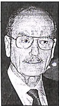
Κωστής Στεφανόπουλος. Όλοι τον εκτιμούν αλλά δεν τον ψηφίζουν όλοι για πρόεδρο